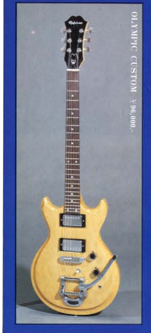
OLYMPIC CUSTOM ¥96,000-