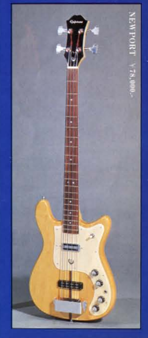
NEW PORT ¥78,000-