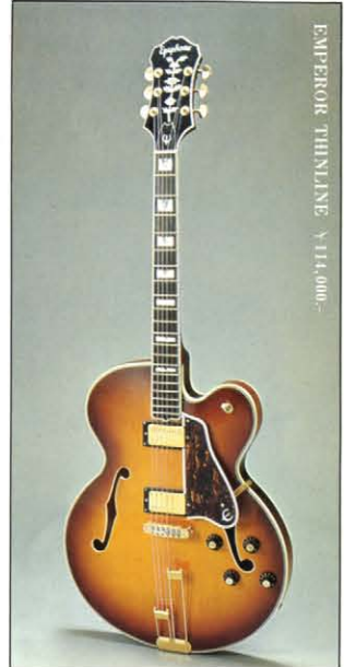
EMPEROR THIRTYONE ¥114,000-

EPIPHONE Acridroll スタッフは、エレクトリックアコースティックギターをさらに完成度高くするべく、ギブソン社の指導によってカジノよりシールドボックスを全モデルに採用します。ボリューム、ジャックを完全にシールドしたため、ガリ・接点不良の原因となるホコリも防ぎ、信頼度は一段とアップしました。