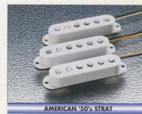
AMERICAN '50's STRAT

全く新しいセンサー理論から開発されたシステムを持つフェンダー・レースセンサー・ピックアップ。「ゴールド・レースセンサー」は、極めてクリアーで上質なビンテージサウンドをローノイズに再現。