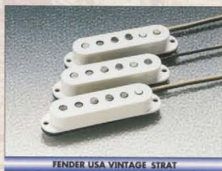
FENDER USA VINTAGE STRAT

BODY : BASSWOOD NECK : MAPLE OVALTYPE, 33.5SCALE / FRETBOARD : ROSEWOOD, 184R, 21F PICKUPS : ST-VINTAGE(USA) x 3 / CONTROLS & SWITCH : 1VOL, 2TONE, 5WAY SW BRIDGE : DIECAST BLOCK SSD VINTAGE COLOR : 3TS, BLK, VWH, CAR