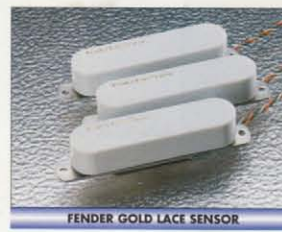
FENDER GOLD LACE SENSOR