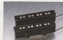
USA VINTAGE JAZZ BASS

BODY: LIGHT WEIGHT ASH / NECK: MAPLE OVALTYPE, 432SCALE FRETBOARD: MAPLE or ROSEWOOD, 184R, 20F / PICKUPS: J-BASS VINTAGE (USA) x 2 CONTROLS: 2VOL., 1TONE / BRIDGE: VINTAGE COLOR: 3TS, NAT