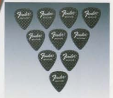
CARBON FIBER PICK ¥200 カーボンクロス原料を100%使用したハードタッチなピック (MEDIUM ONLY)