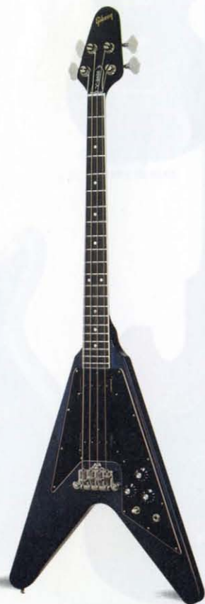
FLYING V BASS