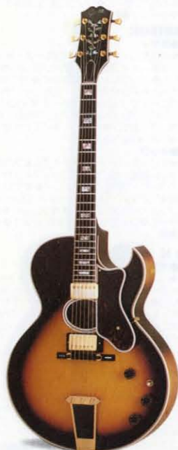
HOWARD ROBERTS ARTIST DOUBLE PICKUP

●ネック ◇3ピース・ソリッド・メイプル◇ナット部幅:1 \frac{1}{8} "◇ローズウッド・フィンガーボード/パール・インレイ◇ギブソン・マシンヘッド(クローム・プレート)◇ギブソン・トラス・ロッド◇22フレット◇25 \frac{1}{2} "スケール◇フィニッシュ:SB、WR◇ケース:515