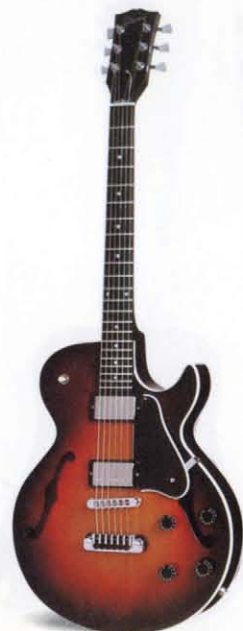
HOWARD ROBERTS FUSION