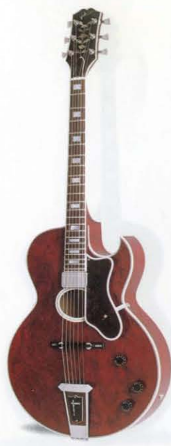
HOWARD ROBERTS CUSTOM