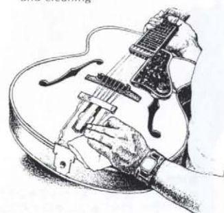
Final inspection and cleaning