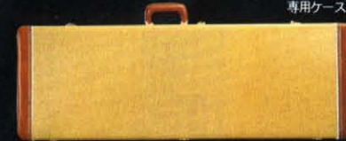
オールド・ケース