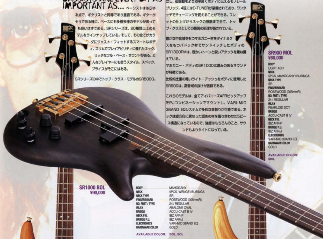
SR1000 BOL ¥90,000

BODY NECK NECK TYPE FINGERBOARD NO. FRET / TYPE INLAY BRIDGE NECK P.U. BRIDGE P.U. ELECTRONICS HARDWARE COLOR