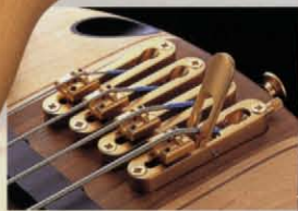
SR1300 PM ¥100,000

D-TUNERを装備しワンタッチで4弦のチューニングをD音まで下げることができます。各弦ごとに分離したブリッジは弦間士の共振を排除し、クリアなサウンド前りに貢献します。