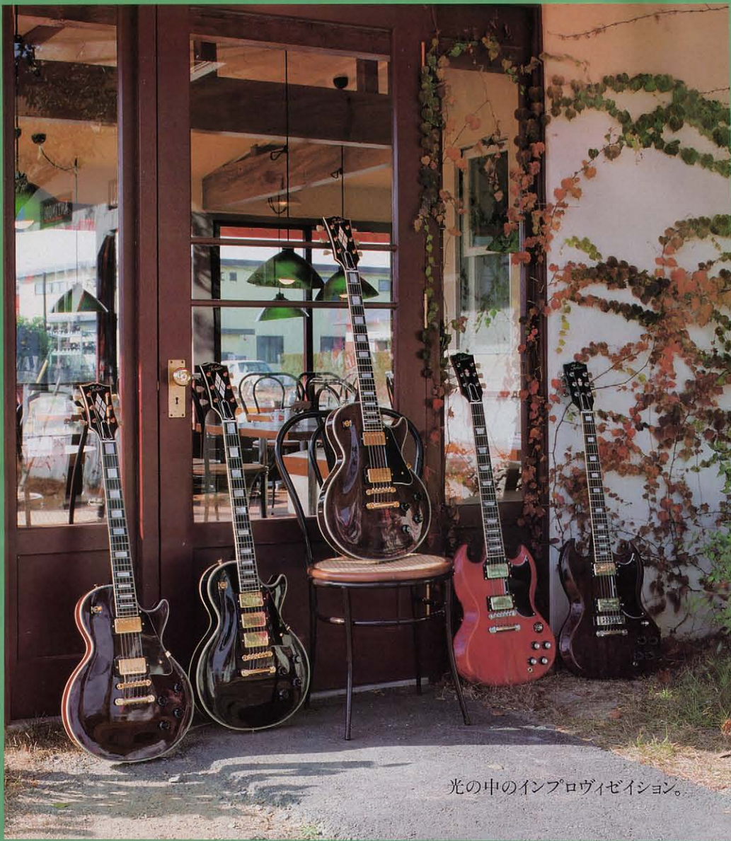
光の中のインプロヴィゼーション。

(左から) TLC60-WR / TLC110-BB / TLC160-WR / TSG60-CH / TSG50-WR