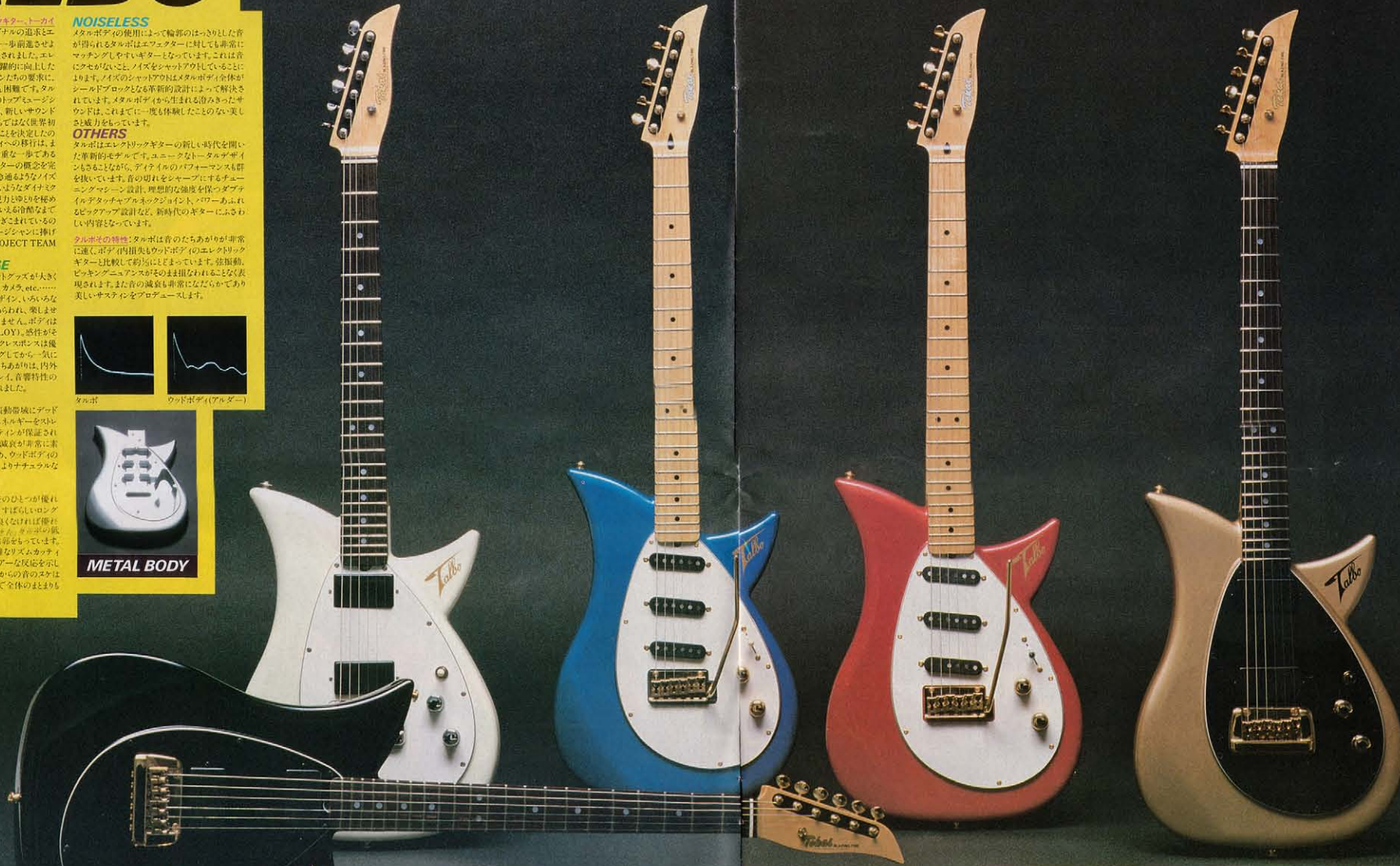
A-100D+BBR(Front) / A-80D+PWR / A-100S+FB / A-100S+FR / A-100D+GMR

タルボの特長は数多くあります。そのひとつが優れた音のバランスです。反応が速くすばらしいロングサステインを誇っても、バランスが良ければ優れたエレックトリックギターといえます。音の質、音の伸び、音の広がりが非常に優れています。後述のリズムカッチングでは信じられないほどのクリアな反応を示してくれます。PA使用時などアンプからの音の伸びは抜群です。一音一音がクリアで全体のまとまりも申し分ありません。