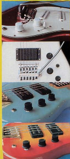
①から⑤ SX-TZ-MBX-LBXコントロールシステム

⑤PU・パラランサー(ベース) このPU・パラランサーコントロールにはフロントPUとリアPUの2つのピックアップを同時に使うことで、このシステムはセンターでまいるようにしており(センター・トラック方式)右に回るとフロントPU、左に回るとリアPUが強調されます。完全に回ると一方のPUの出力は0となります。このPU・パラランサーは互いに出力の異なるPUの組み合わせの時、威力を発揮するほかでなくサウンド・パレットともなりあがります。