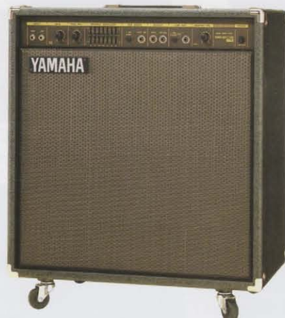
SR80B-115 [80W モデル] ¥110,000(税抜き)

ステージからスタジオまで幅広く対応する160W。スタックアップSRの音圧感をビルトインで再現したフロントオープン・バスレフエンクロージャー採用モデル。 ●定額出力=160W/4Ω ●スピーカー=36cm(40)X1 JA3821 ●コントロール=マスターボリューム、7バンド・グラフィックEQ、トーンバランス、ゲイン、リニア/外SW(アンプ/ボア対応)、ミッドシェイプオン/オフSW ●入力端子=メインアンプ(HIGHX1, LOWX1)、エフェクター ●出力端子=ラインアウト、エフェクターアウト ●フットスイッチ ●LED=パワー、コンプ、ミッドシェイプ、オーバーロード ●寸法=607W×307D×382D(mm) [キヤスター含む] ●重量=10kg