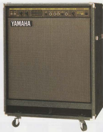
SR160B-115 [160W モデル] ¥150,000(税抜き)

も際立つベースサウンドを出力します。 ■フルパワー時にも歪みのないクリーンなサウンドを出力するコンプ・リミッター回路。■ベースのタイプを選ばないアクティブ/パッシブ2インプット。■レンジの広いトーンバランス・コントロール。厳選された7バンドグラフィックイコライザー、スラップ奏法対応のミッドシェイプSW。■シリアル操作を追求し、コントローラー、ジャックのすべてをフロントパネルにレイアウト。■プリまたはポストイコライザーの系統選択ができるラインアウト端子を装備。さらに、ラインアウト端子とエフェクター端子の接続により、ベース原音のキャラクターを本体スピーカーからダイレクトに出力。■オプションのフットスイッチ[FS-1W1.500(税抜き)]により、ミッドシェイプのオン/オフは足元で可能。