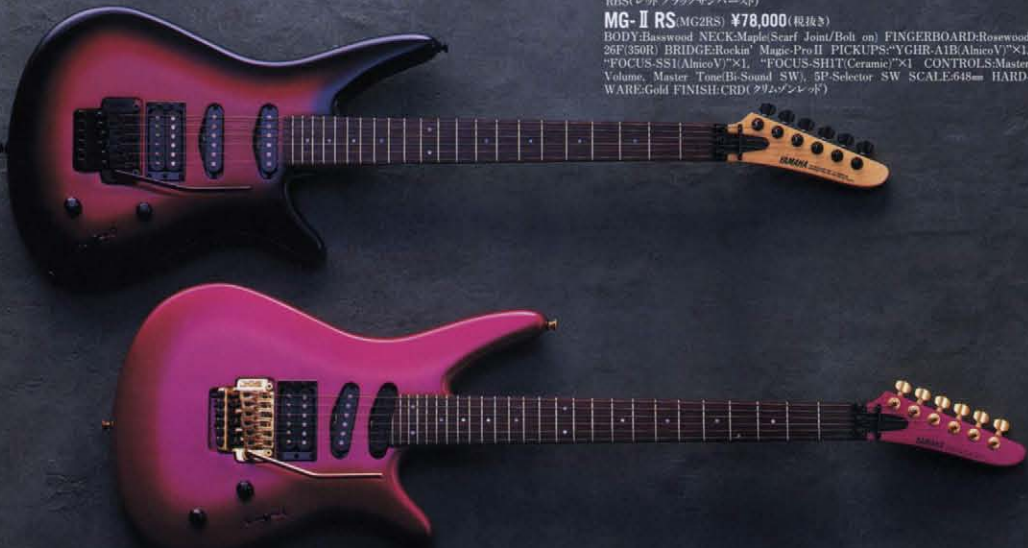
Upper: MG Standard (RBS), Under: MG-II RS (CRD)

BODY: Basswood NECK: Maple (Scarf Joint/Bolt on) FINGERBOARD: Rosewood 26F(350R) BRIDGE: Rockin' Magic-Pro II PICKUPS: "YGHR-A1B(Alnico V)"×1, "FOCUS-SSI(Alnico V)"×1, "FOCUS-SHIT(Ceramic)"×1 CONTROLS: Master Volume, Master Tone, B-Sound SW, 5P-Selector SW SCALE: 648mm HARDWARE: Gold FINISH: CRD (クリムゾンレド)