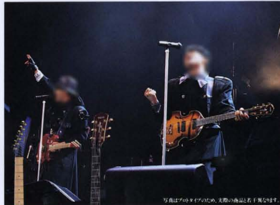
写真はプロタイプのため、実際の商品とは若干異なる場合があります。