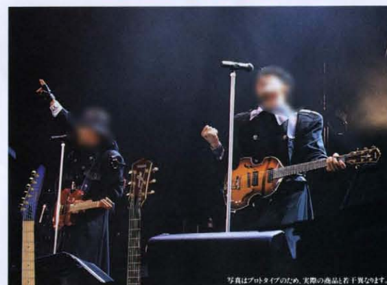
写真はプロタイプのため、実際の商品とは若干異なります。