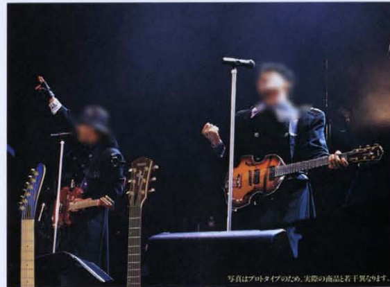
写真はプロタイプのため、実際の商品と若干異なる場合があります。