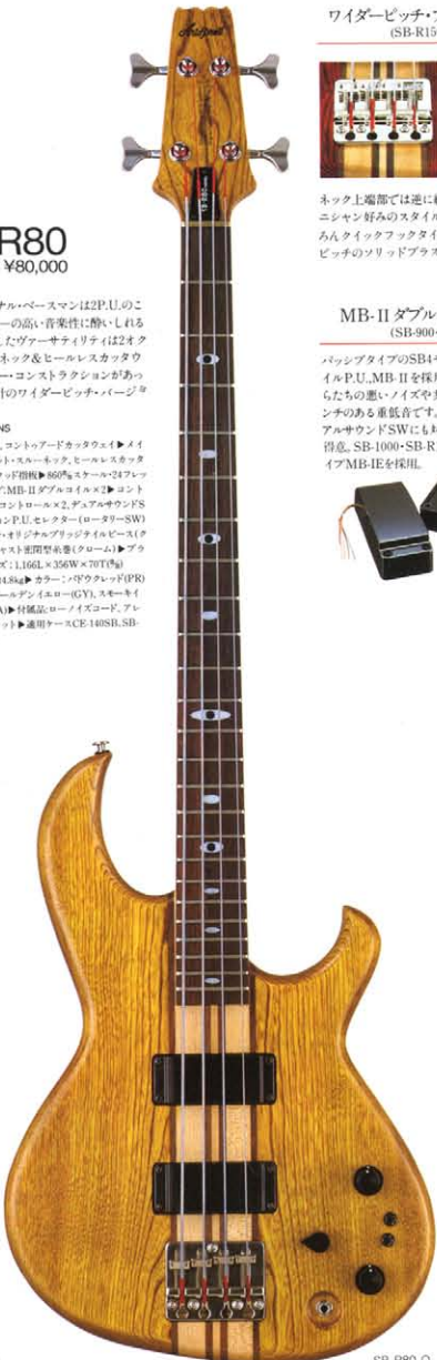
ワイドーピッチ・ブリッジ・ダブルコイルピッチ (SB-R150・R80・R60)