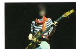
John Taylor (DURAN DURAN) SB-700