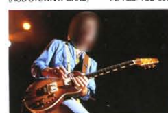
Neal Schon (JOURNEY)