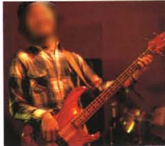
Yu Fujii SB-R60