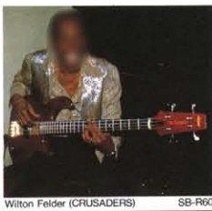
Wilton Felder (CRUSADERS) SB-R60

▶アッシュボディ、コントールドカッタウェイ▶メイプル/ウォルナットスルーネック▶ヒールレスカッタウェイ▶ローズウッド指板▶60%スケール▶24フレット▶ピックアップ:MB-IIダブルコイル×2▶コントロール:VTR搭載コントロール×2,デュアルサウンドFSW▶ワイドーピッチハイブリッドブリッジ(フルスケール)▶ダイキヤスト製タロームプレート▶フックシステムはもみんタイプ▶サイズ:1166L×356W×65T(%)▶ウェイト:平均4.7kg▶カラー:アークワッド(PR),オーガ(O),ゴールド(E),スモーク(Y),スキーアンバー(SA)▶付属品:ローノイズコード,アレンションキック▶適用ケース:1405B,SB-73BASS