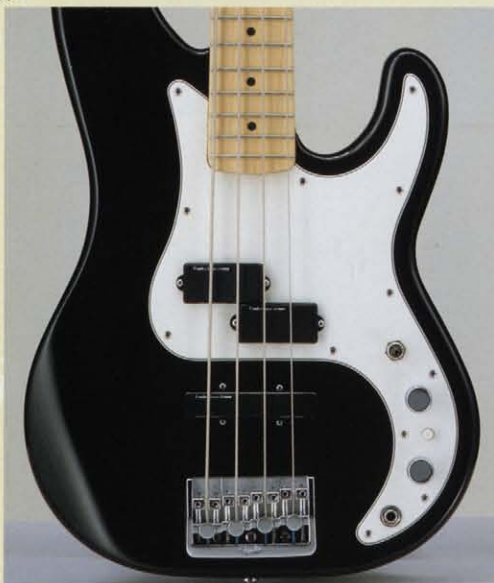
Precision Bass Plus Body

プレジジョンベース・プラスはその名のごとく正確なチューニングを可能にするファインチューナブル・ブリッジを搭載。