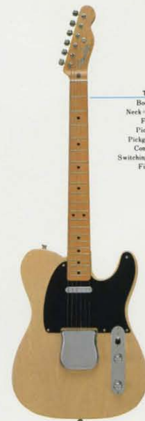
TL'52-65 ¥65,000 Body=ソリッドアッシュボディ Neck=1ピースハードメイプルネック Fretboard=メイプル指板 Pickup=ヴィンテージPU×2 Pickguard=ベークライトブラック Controls=1891ヌーム、11トーン Switching=リード/リード+リズム/リズム Finish=ポリエステル仕上げ Color=BLD/BSB