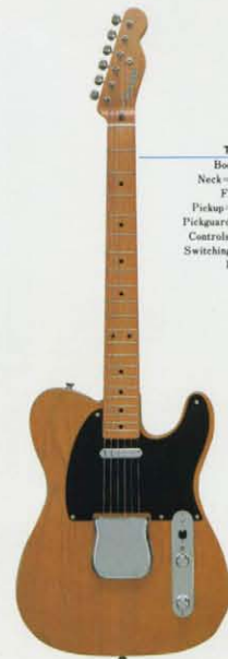
TL'52-95 ¥95,000 Body=ソリッドアッシュボディ Neck=1ピースハードメイプルネック Fretboard=メイプル指板 Pickup=ヴィンテージPU×2(U.S.A.) Pickguard=ワイバーブラック(U.S.A.) Controls=1891ヌーム、11トーン(U.S.A.) Switching=リード/リード+リズム/リズム Finish=クッカー仕上げ Color=BSB/BLD