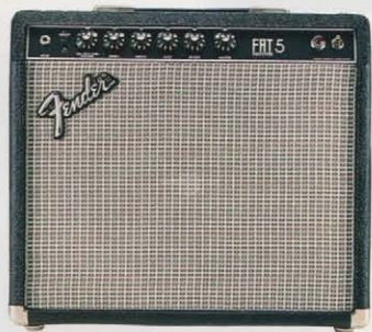
FAT 5 ¥102,000(フットスイッチ付属)