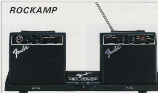
SET PRICE ¥12,800

あなたの机の上がそのままだけあるステージに変わります。魅力のギタートレーニング・システム“ロックアンプ”。ベストセラーを記録したミニアンプ“MA-10”をグレードアップさせ、より強力なディストーションサウンドと、トーンコントロールを装備させたミニギターアンプ“GA-10”をシステムの核としてセット。サポートするチューナー/ラインアンプ“TA-10”は、FM/AMをワイドバンドに受信し、しかもウォークマンやCDプレーヤーなどがダイレクトにインプットできるラインイン端子さえも装備してあるマルチな機能が特徴のステレオ。そして、この2つのユニットをスマートにセットアップしてしまおうのがデスクトップシステムユニットの“MS-1”。今日からあなたの机の上がステージに変わります。