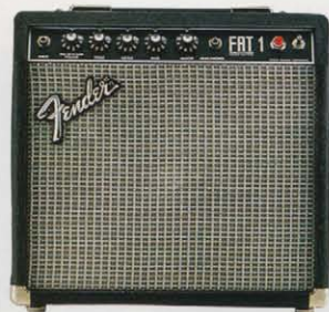
FAT 1 ¥61,000

チューブパワーをストレートに伝えるご機嫌なエミネンスのスピーカーをフィーチャーしたフェンダーオールチューブアンプ“FAT”は、ビュアなチューブサウンドを追求し開発、完成させたプロフェッショナルギア。FAT-1は25センチ、FAT-3、FAT-5は30センチスピーカーそれぞれ一発を抱え、フェンダー特有のコントロール系によりブラダインの瞬間から身体中が心地よいドライブ感に包まれる。ストラトキャスターやテレキャスターのシングルコイルピックアップでめりめりを効かせるのもいいが、ハムバックカーでうならせるのも刺激的。優れた基本性能を備えたアンプだけが獲得できる高品位なサウンドの世界がFATにはある。