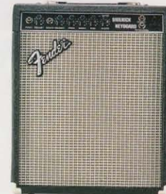
SIDEKICK KB ¥33,000