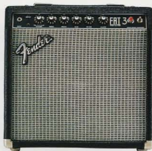
FAT 3 ¥86,000(フットスイッチ付属)