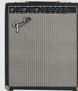
SIDEKICK 35KB ¥50,000