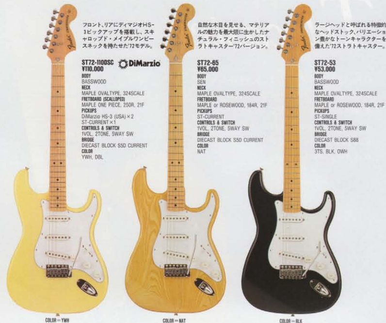
COLOR = VWH

味わい深い独特のトライアングルタイプのネックフィーリングを持つ'54バージョン。 ラージスタイルのヘッドストックを特徴としている'72バージョン。 引き込みほどにそのとりことなってしまうプロ好みのストラトキャスター。