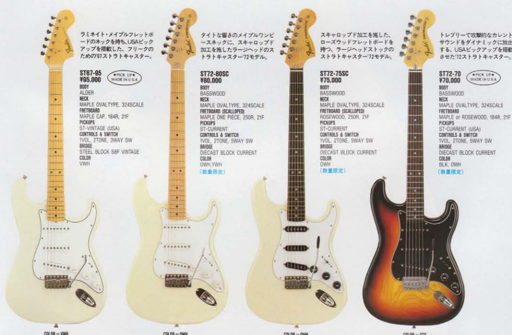
COLOR = VWH

ST54-53 ¥53,000 BODY BASSWOOD NECK MAPLE VTTYPE, 324SCALE FRETBOARD MAPLE ONE PIECE, 184R, 21F PICKUPS ST-SINGLE CONTROLS & SWITCH 1VOL, 2TONE, SWAY SW BRIDGE DIECAST BLOCK S88 COLOR T, BLK