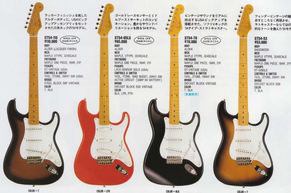
COLOR = T

ST72-53 ¥53,000 BODY BASSWOOD NECK MAPLE OVALTYPE, 324SCALE FRETBOARD MAPLE or ROSEWOOD, 184R, 21F PICKUPS ST-SINGLE CONTROLS & SWITCH 1VOL, 2TONE, SWAY SW BRIDGE DIECAST BLOCK S88 COLOR 3TS, BLK, OWH