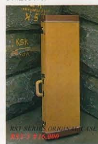
RST SERIES ORIGINAL RST-70 ¥16,000

トレスティシヤがなムードの中にゴールドトーンが絡みつき、輝きを見せるゴールドトーンST。'57MODELは、アムステルダムでコンプレックス・セック・カール、'64MODELは、オランダのP. U. + サークルで、ボグ・イッサーとの絶妙なコンビネーションによる音響を創り出した。