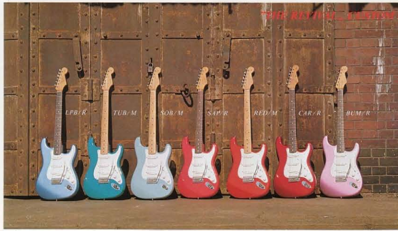
写真はカスタムカラーのバリエーションです。定価の1万円アップでオーダーすることが出来ます。RST-50 ¥90,000、RST-50 ¥98,000/2wayです。