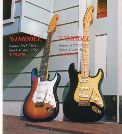
'64MODEL Photo: RST-70-64 Stock Color: YSO ¥70,000