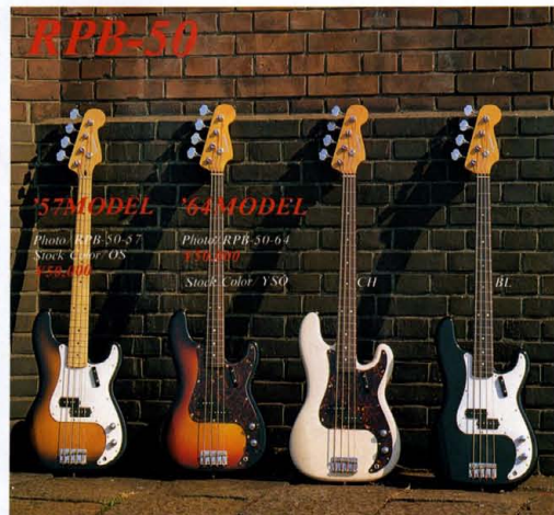
RPB-50 '57MODEL '64MODEL

Photo: RPB-50-57 P.S. 006 Stock Color: OS Photo: RPB-50-64 P.S. 006 Stock Color: YSO