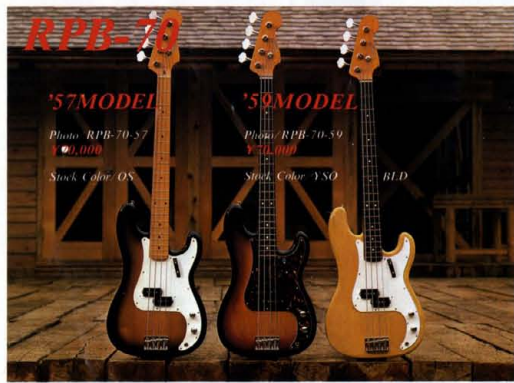
RPB-70 '57MODEL '59MODEL

Photo: RPB-70-57 P.S. 006 Stock Color: OS Photo: RPB-70-59 P.S. 006 Stock Color: YSO