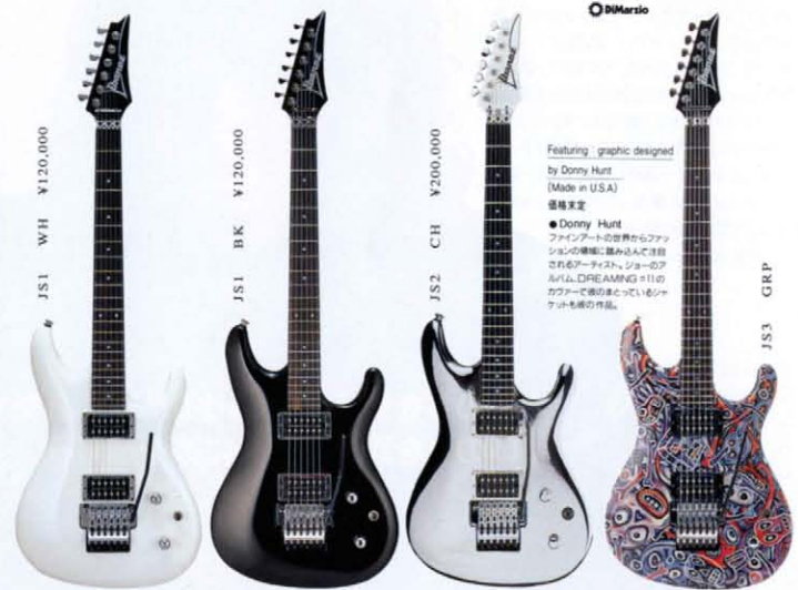
JS1 WH ¥120,000