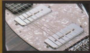
SKY H100 Pickups

50、60年代のモダンな音響特性をもったシングル・トレモロ。シンプルながらも確かな音質と、独自の調整機構により安定します。また、音量調節のつまみを搭載しているため、演奏中にゲイン調整が可能です。