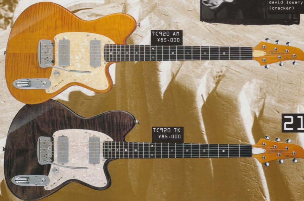
TC920 AM ¥85,000

SKYリップスティック・ピックアップは、アーム・ストローク長、フレーム・デザインで有名なボルト・アーム・ロック式の構造によりデザインされた。リップスティック・ピックアップは、サウンドを調整可能なサウンドを出力し、音域、アンプ・ゲイン・オフ・オン・サウンドを切り替えます。