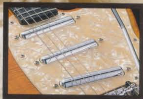
SKY Lipstick Pickups

SKYリップスティック・ピックアップは、アーム・ストローク長、フレーム・デザインで有名なボルト・アーム・ロック式の構造によりデザインされた。リップスティック・ピックアップは、サウンドを調整可能なサウンドを出力し、音域、アンプ・ゲイン・オフ・オン・サウンドを切り替えます。