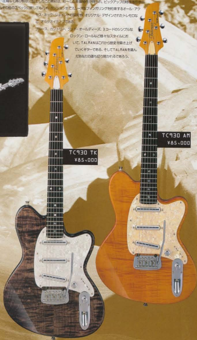
TC930 TK ¥85,000