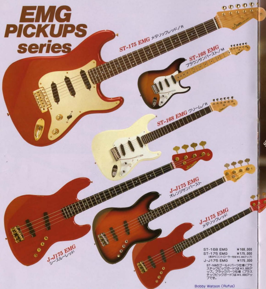
ST-175 EMG メタリックレッド/R