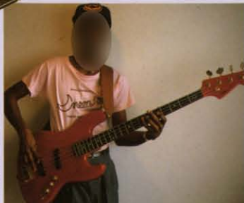
Victor Bailey (Weather Report)

J-J198 Alembic ¥198,000 J-J175EMG及びJ-J198Alembicのフレットレス仕様(ノンポジション又は“Jaco”タイプ)は各 ¥10,000アップです。