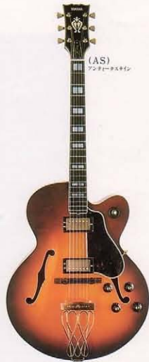
(AS) アンチノックシステム

よりリアリットなサウンドはフュージョン 音楽に一番豊かなニュアンスを。独自の バイセクショナルシステムは内蔵。プロクラス チューナーのコレクションに不可欠な逸品。 マイク＝ハンバッキングE・1×2 コントロール＝ボリューム×2、トーン(ブ シロックS W付)×2、3点S W×1 胴＝アークスプレーレス単板トップ 胴＝メイプル/指板＝オールドエボニー 胴＝セミアコネック 糸巻＝ヤマハオリジナル調整付 弦＝ギブソン040L/重量＝3.6kg ¥120,000