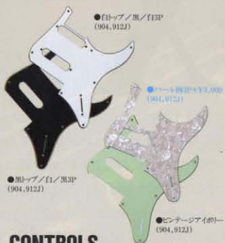
●白トップ/黒/白SP(904, 912) ●黒トップ/白/黒SP(904, 912) ●ブルーボディ+¥3,000(904, 912) ●ピンテージアイボリー+3P(904, 912)

オーダーメイド・ギターの様々な個性に対応し、オーブドックスな白トップ/黒/白、黒トップ/白/黒のほか、904のレギュラーモデルで好評のピンテージアイボリー、高級感を演出するパール柄の4種を用意。裏面には導電金属を装着し、外來ノイズ対策は万全。