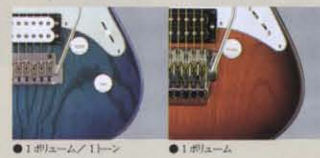
●1ボリューム/1トーン ●1ボリューム

1ボリューム/1トーン・タイプは、柔軟な音創りが可能なスタンダード・スタイル。トーン回路がなく電気ブリクションの少ない1ボリューム・タイプは、ハイ音域にシビアなハードロック系に向く。ポットは、暖かいニュアンスを持つCTS製で、回転フィールを備えた特注モデルを使用。セクターは、ヤマハオリジナルの専用4 Pole5Pタイプ。