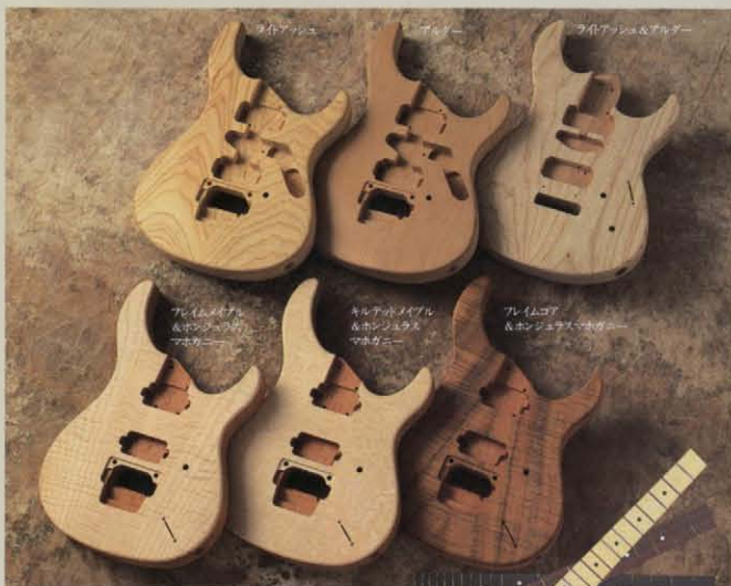
エボニー ローズウッド メイプル

オーダーメイドパシフィカには、1本1本に押し作られたカードが付属。オーダーメニュー、シリアルナンバー、そしてマスタービルダーの名前が記され、世界で唯一あなただけのパシフィカを証明します。