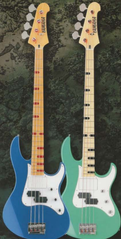
※写真の仕上げは実際の商品とは異なります。