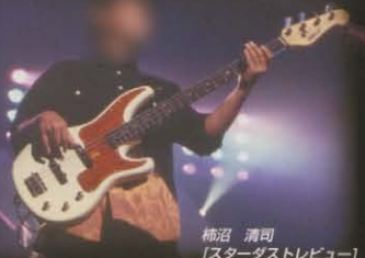
柿沼 清司 【スターダストレビュー】