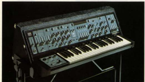
●スタンドKS-10 (別売) ￥15,000 ●フットボリューム (別売) FV-1 ￥6,800 / FV-2 ￥8,000