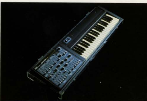
●スタンドKS-10 (別売) ￥15,000 ●フットボリューム (別売) FV-1 ￥6,800 / FV-2 ￥8,000